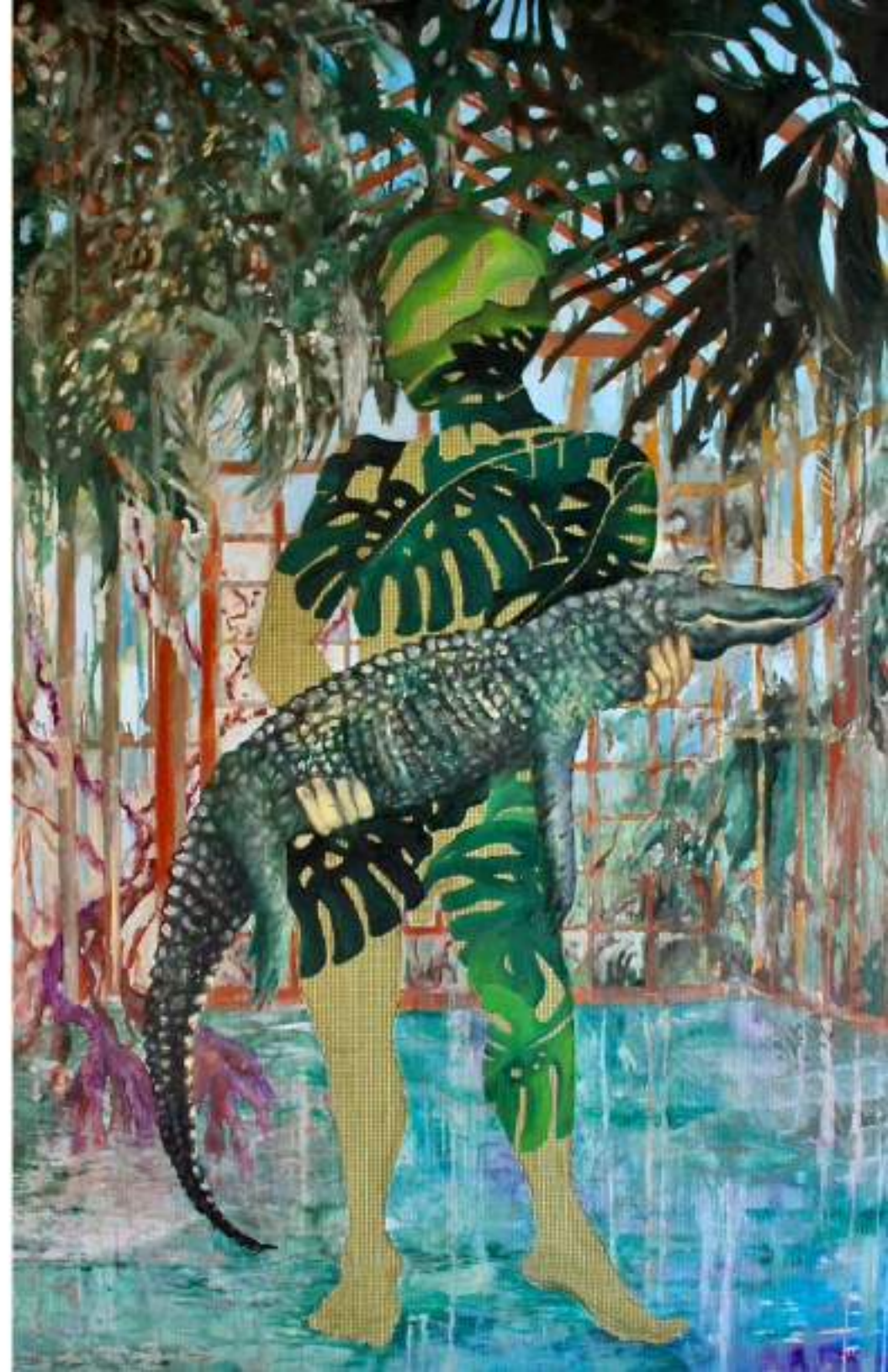
Crystal Palace ( the Hunter) ACRYLIQUE ET HUILE SUR TOILE 180 X 120 CM (2021)

Orient idéal : la maîtrise de l'exotisme et le génie de la nouveauté sont les valeurs marchandes suprêmes et « Les créatifs, on le dit de temps en temps, sont ceux qui empêchent le tout de sombrer dans des routines nocives. » (Sloterdijk dans Le Palais de cristal ).