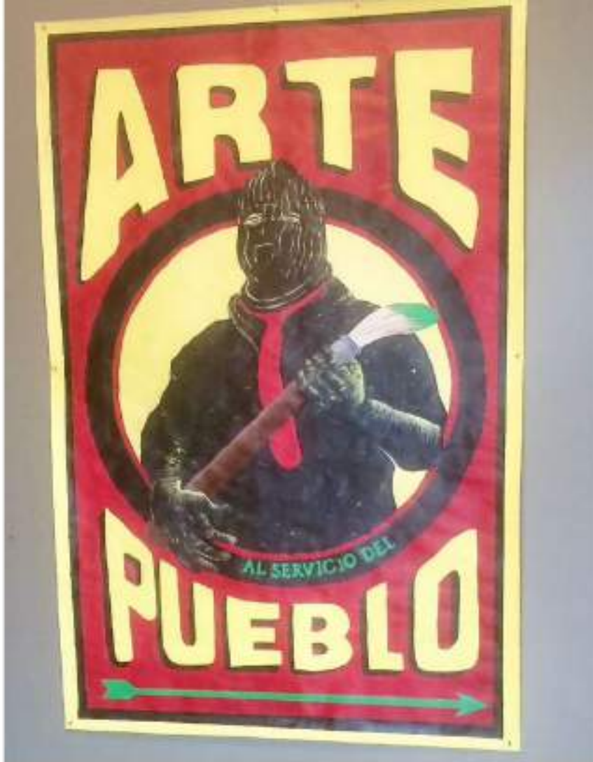
Arte al servicio del pueblo (Agitprop) ACRYLIQUE SUR PAPIER, 200 X 130 CM (2020)