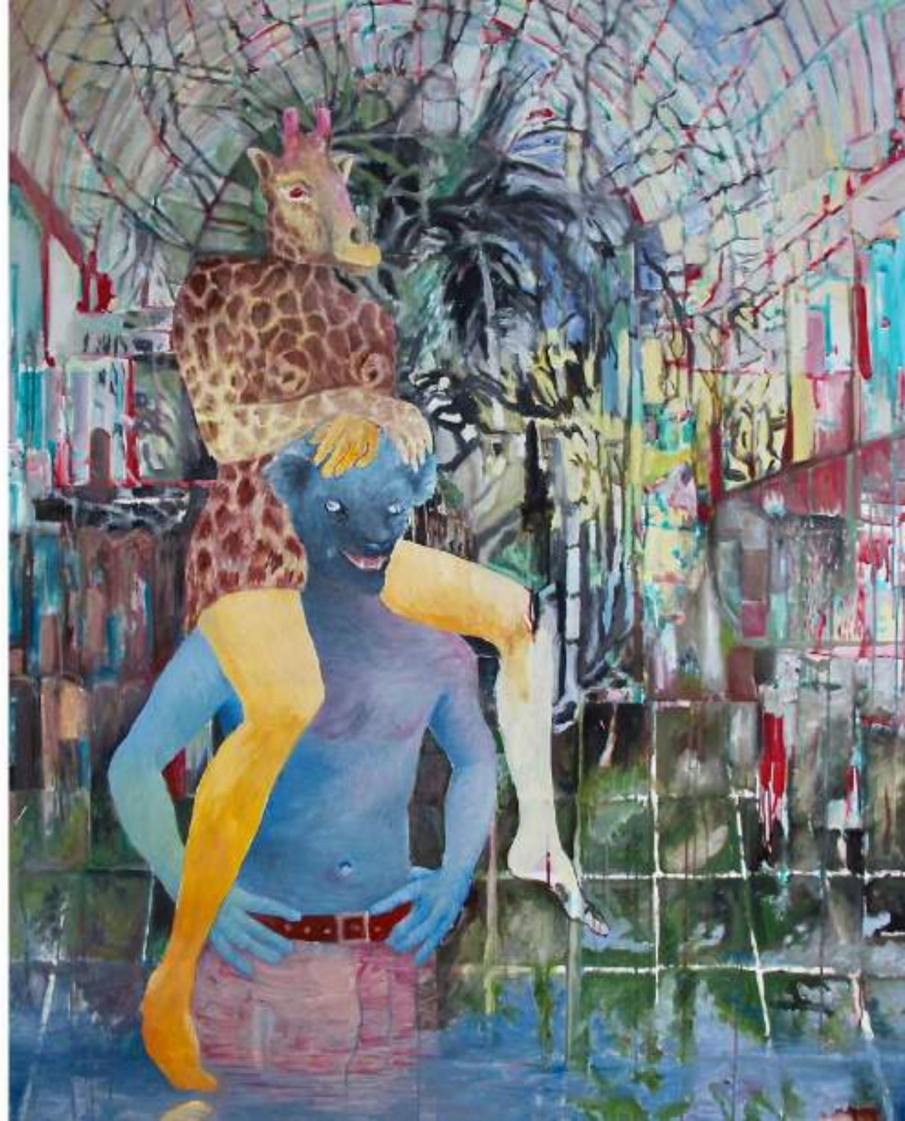
Crystal Palace (sur les épaules du loup) HUILE SUR TOILE 150 X 120 CM (2020)

Curieuse allégresse d'une génération embourbée dans le reflet d'un ciel artificiel et dont l'horizon est de réinventer des apocalypses de jouissance enfermée sous une verrière inamovible.