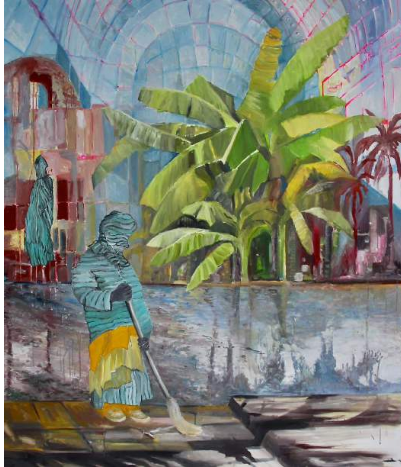
Crystal Palace / Orient idéal HUILE SUR TOILE 150 X 120 CM (2020)

DIPLÔME ÉDUCATION SECONDAIRE ARTS VISUELS IFMES 2001 DIPLÔME PEINTURE ET MEDIAS-MIXTE ESAV GENÈVE 1996 CERTIFICAT ATELIER ARNO STERN 1995