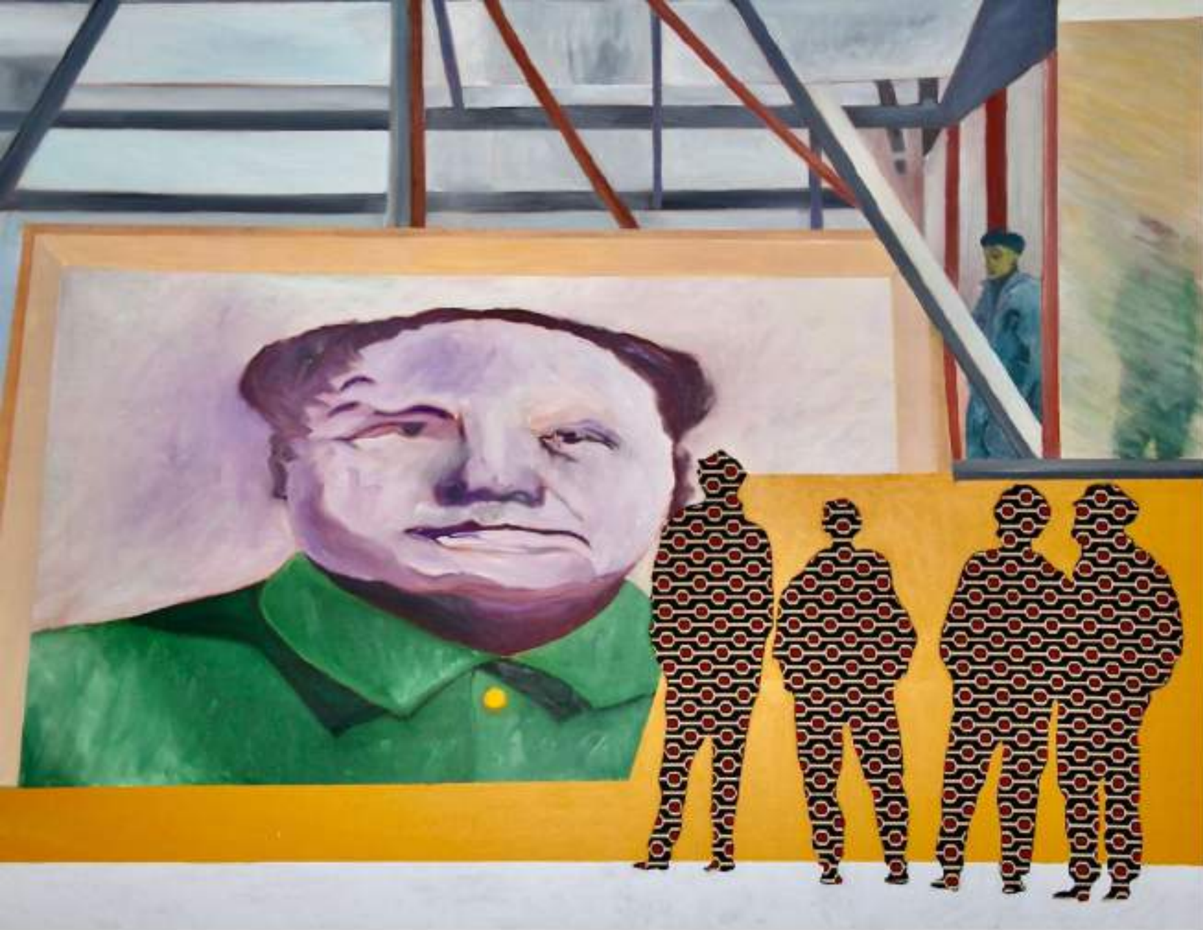
Abenddämmerung LAQUE, HUILE SUR TOILE 155 x 125 CM (2021)