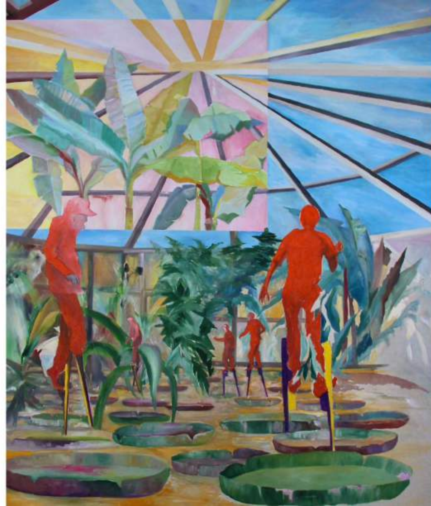
Crystal Palace (Les échassiers) HUILE SUR TOILE 150 X 130 CM (2021)

Si dépouillé, l'individu est une bête qui a perdu jusqu'à sa face. Si comblé, il a perdu jusqu'à la substance de son ombre. Couvert de parasites et animé par une avidité hystérique, absurde et indéfiniment renouvelée, c'est le citoyen d'un État final, fœtal et bestial.