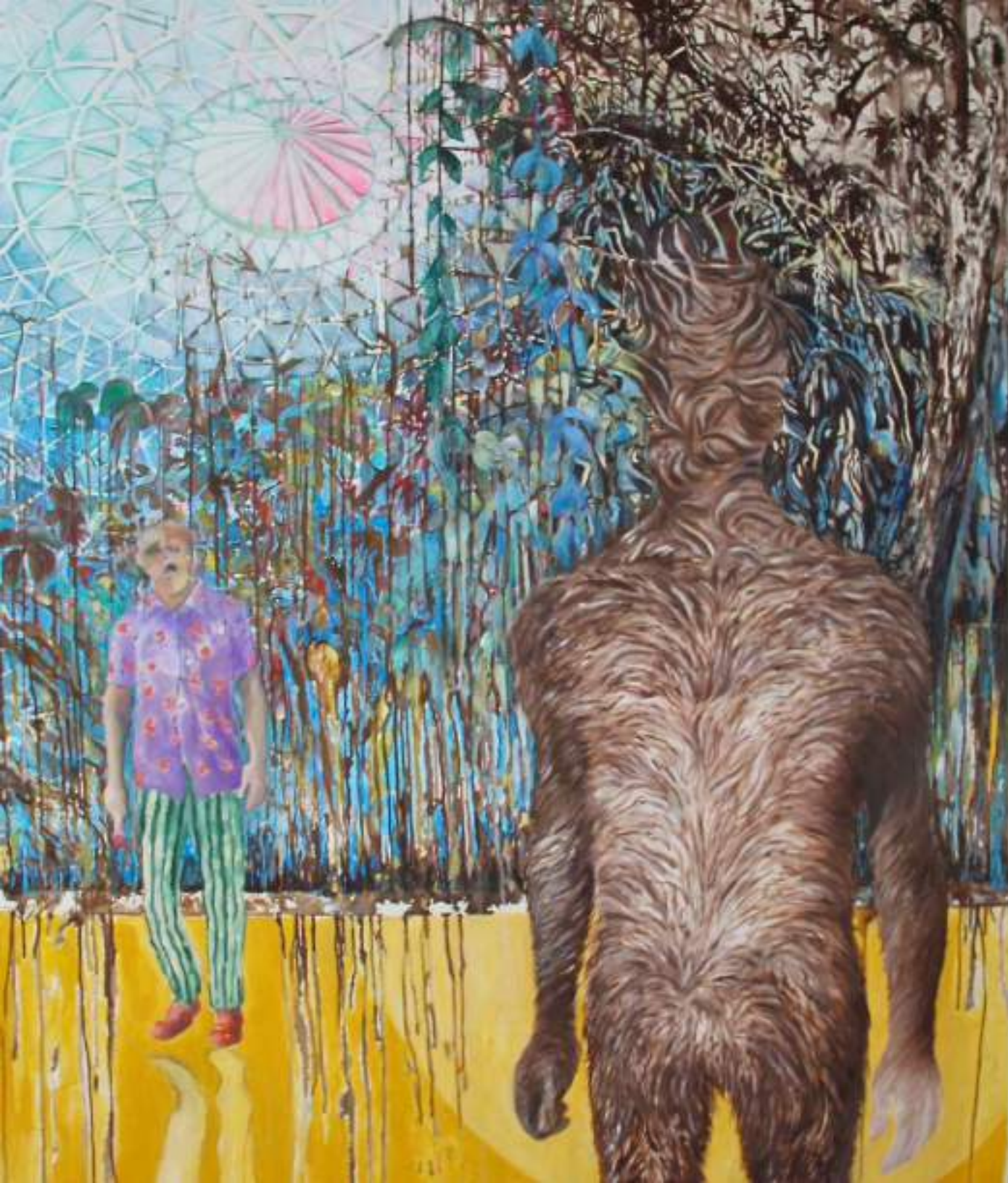
Crystal Palace (Utérotopia) ACRYLIQUE ET HUILE SUR TOILE 160 X 146 CM (2021)

Si dépouillé, l'individu est une bête qui a perdu jusqu'à sa face. Si comblé, il a perdu jusqu'à la substance de son ombre. Couvert de parasites et animé par une avidité hystérique, absurde et indéfiniment renouvelée, c'est le citoyen d'un État final, fœtal et bestial.