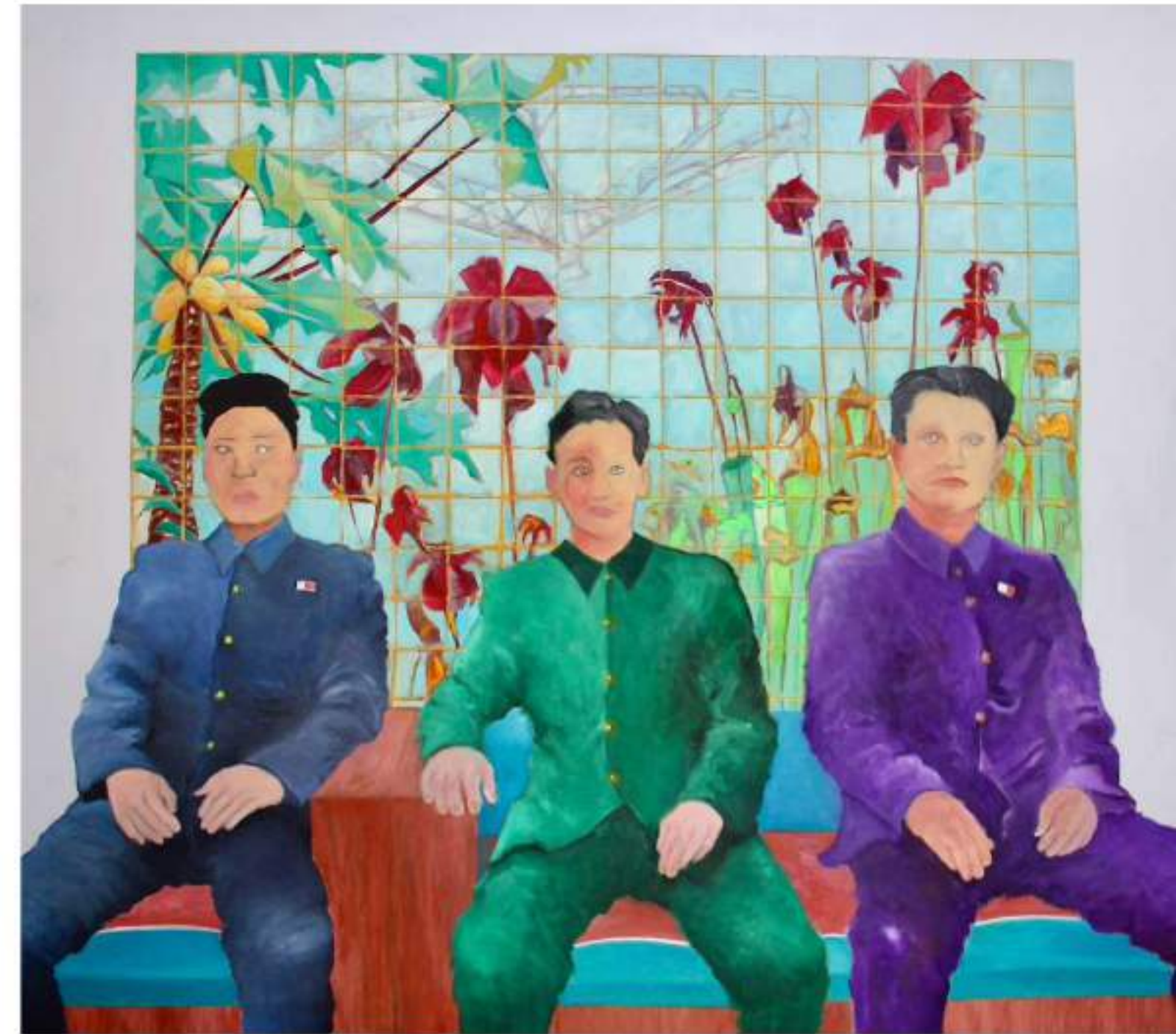
The Sublime Object of Ideology LAQUE, ACRYLIQUE ET HUILE SUR TISSUS 130 x 118 CM (2021)