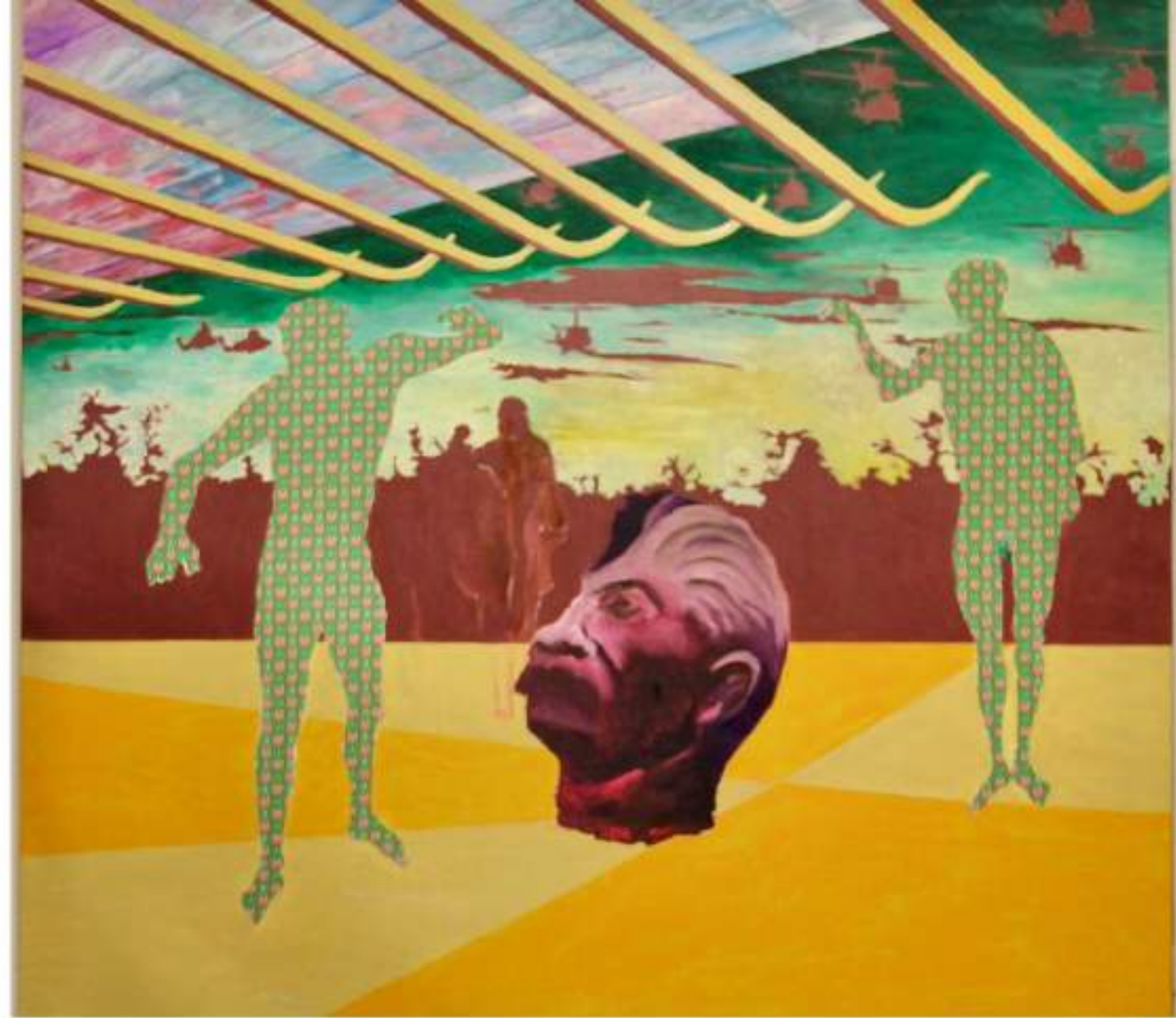
Ghostdance LAQUE, ACRYLIQUE ET HUILE SUR TISSU 135 X 125 CM (2021)