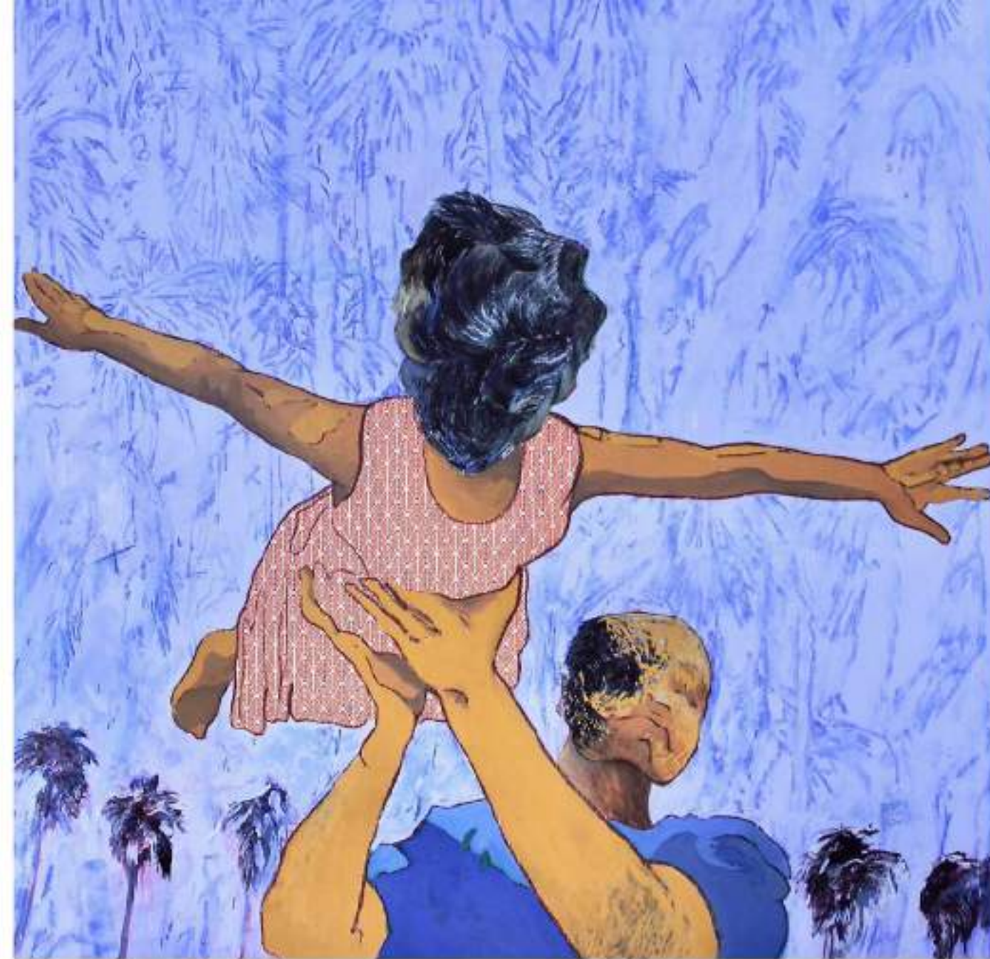
Young wings can fly LAQUE, ACRYLIQUE, PASTEL SUR TISSU 120 X 120 CM (2021)