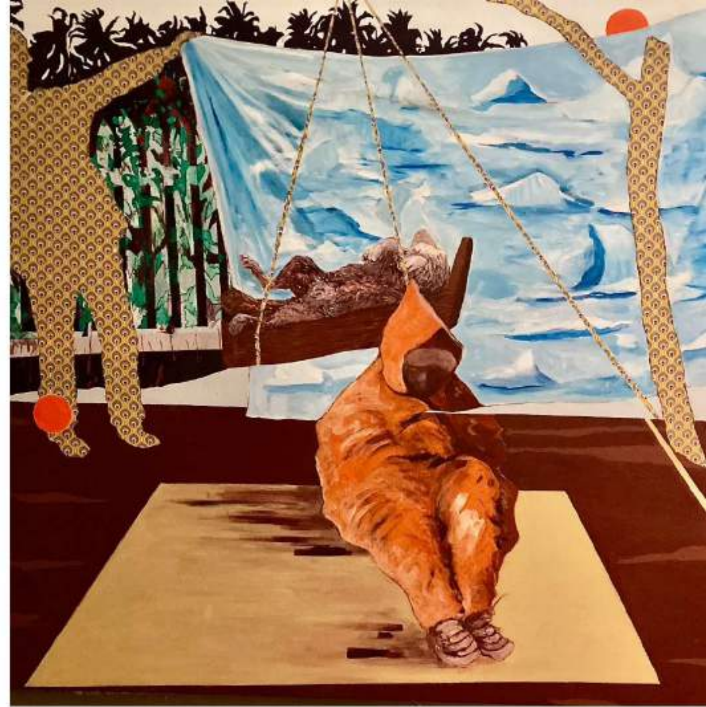
Franz LAQUE ET HUILE SUR TOILE 150 X 120 CM (2022)