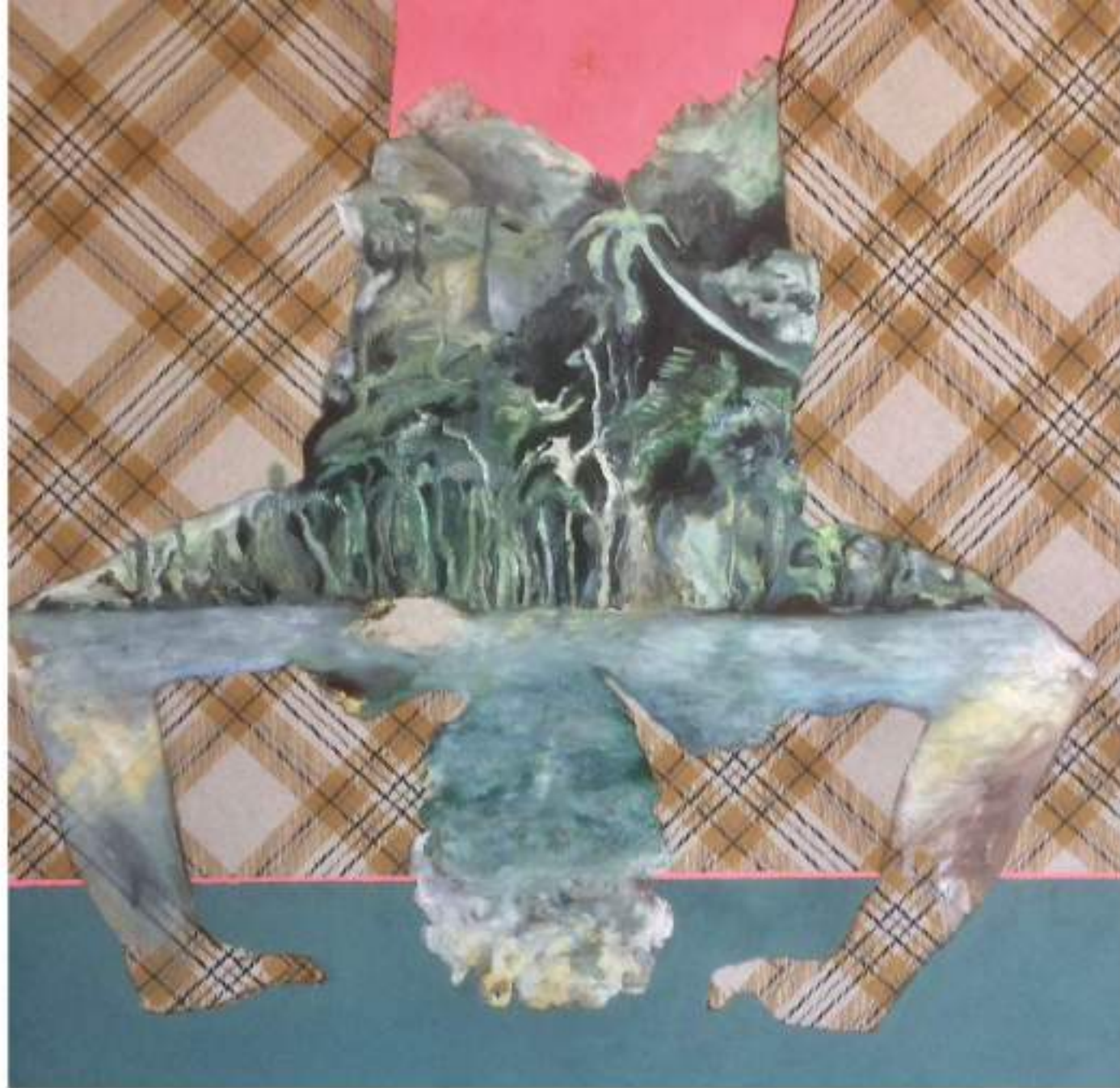
Drowned LAQUE, HUILE SUR TISSU 80 X 80 CM (2020)