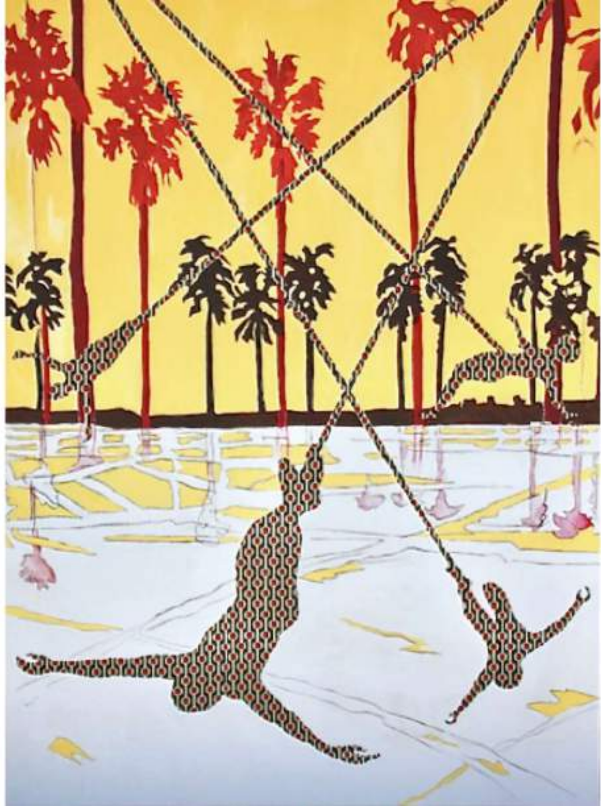
Voladores ACRYLIQUE ET PASTEL SUR TISSU 175 X 130 CM (2021)